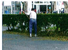
(事務所の周りを掃除していただきました)

ない時は必ず事務所に連絡するなど シルバー組織の「共働・共助」を理解し皆仲良く笑顔で頑張りましょう！