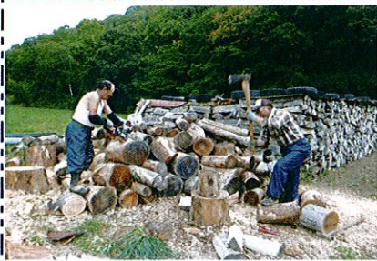
(マキ割りの就業中)