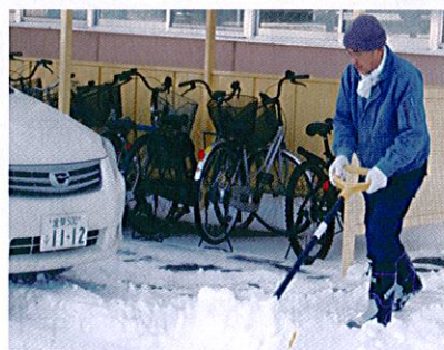
駐車場の除雪作業