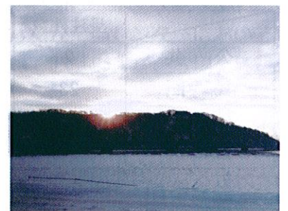
平成25年（巳年）の夜明け