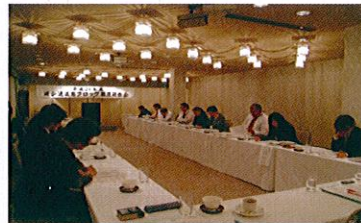
職員研修会の様子