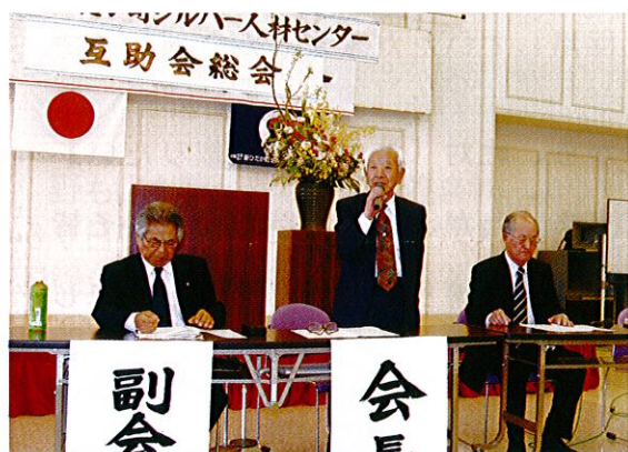
開会で挨拶する照井互助会会長

事業報告、決算・監査報告が報告通り承認され、事業計画として、同好会活動事業・親睦交流事業として①1泊研修旅行②新年親睦会の開催③「カラオケ夢舞台」への参加等が確認され、予算案についても提案通り可決されました。