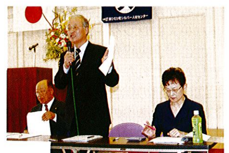
提案する福地局長