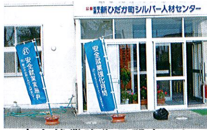
安全就業強化月間中です