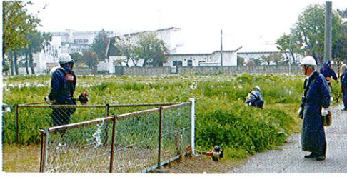
事務所周辺の草刈りボランティア