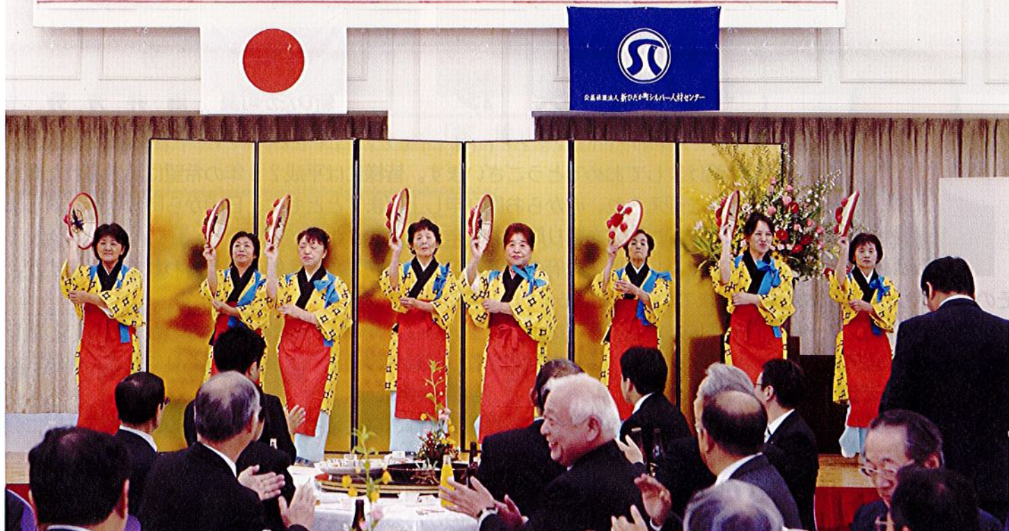
創立20周年記念祝賀会 (2013. 11. 1)