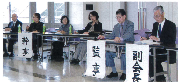
互助会役員の皆さん↑