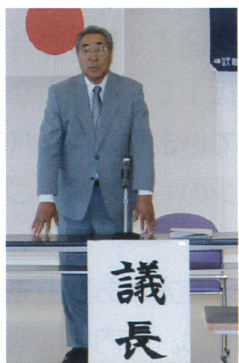
外崎議長就任挨拶