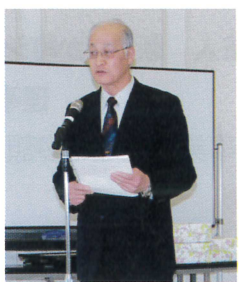
提案中の福地局長