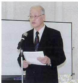
提案中の福地局長