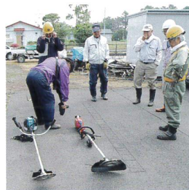
安全就業講習会 刈払機の点検、使用上の留意点等の確認

30年度における安全就業については、傷害、賠償事故ともに無事故で終わり、今年度も引き続き「安全パトロール」を中心に活動することが確認されました。