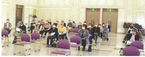
密集密接回避の為テーブルなしの会場設営

派遣事業実績 一方派遣事業実績は、21件の契約があり、就業延日人員、契約金額が前年を上回り、目標数値を達成することができました。しかしながら、請負、派遣の合計契約金額は前年比8.2%の減収となりました。