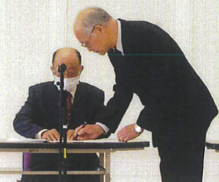
進行等確認をする 理事長と福地局長

令和元年度も基本方針と実施計画に基づき就業拡大等の事業展開を進めて参りました。当センターの事業の推進にご理解とご支援をいただいております新ひだか町をはじめ各事業所、一般家庭の皆様並びに賛助会員の方々に心から感謝申し上げます。