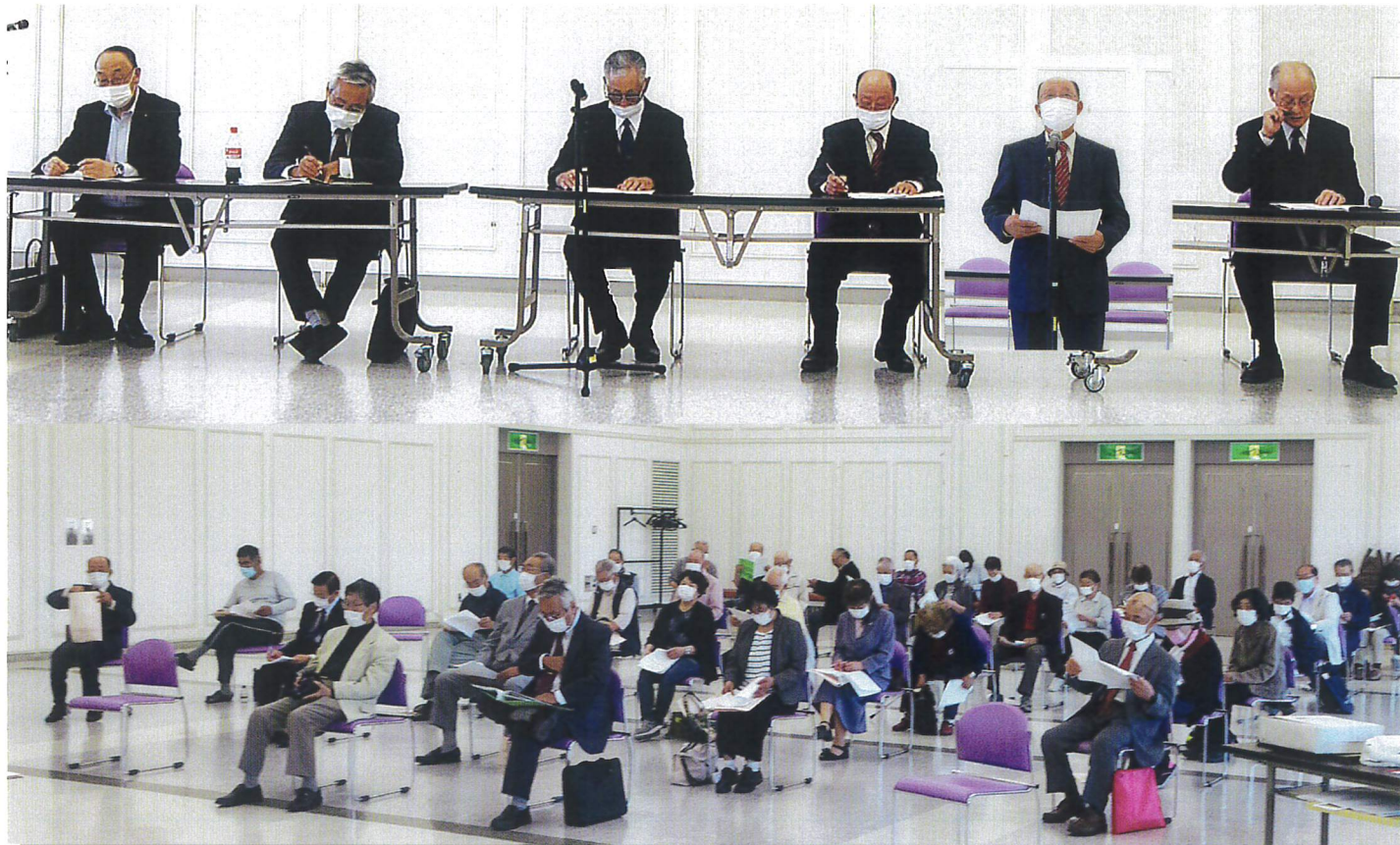
令和2年度 公益社団法人 新ひだか町シルバー人材センター「定時社員総会」

ホームページアドレス http://www.shinhidaka-sc.or.jp ☎0146-43-2800