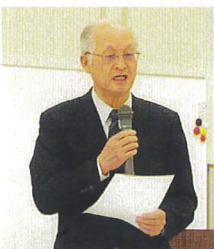
提案中の福地局長