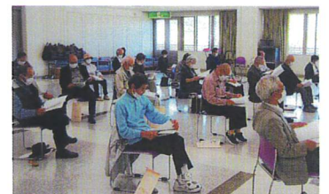
総会参加者の皆さん介机を置かず間隔を広く